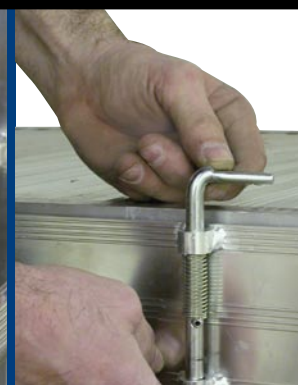
Mehanizam za zaključavanje platforme