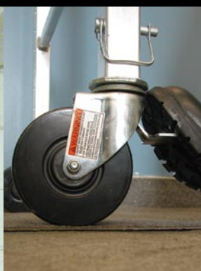
12,7 cm Kotači sa dvostukim zaključavanjem