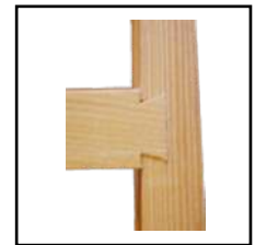
Spajanje po sistemu "lastin rep" osiguravaju stabilnost i sigurnost.