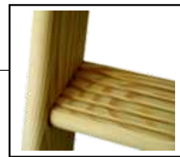
Uzdužne perforacije na gazištima radi sigurne uporabe.